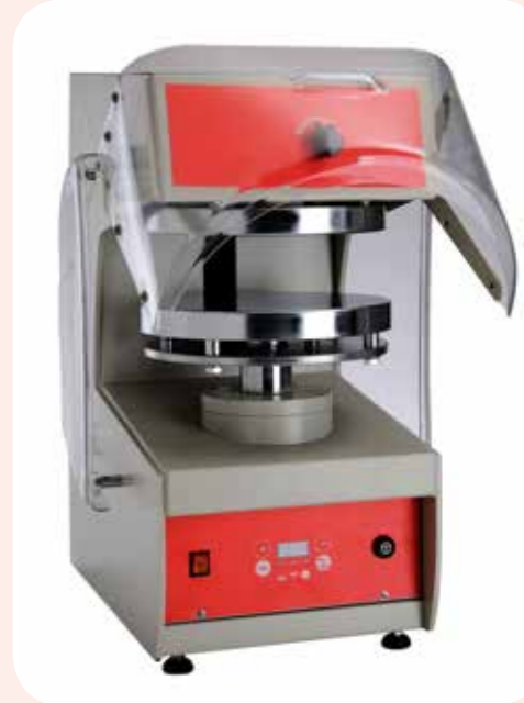
PRESSE FORMATRICI PIZZA Alimentazione elettrica. Pressa formatrice a caldo per pizze 350 mm. Dimensioni LxPxH: 500x610x770 mm.