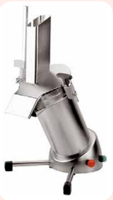
PORZIONATRICI ARROTONDATRICI Alimentazione elettrica. Capacità tramoggia di 30 Kg. Dimensioni LxPxH: 765x765x1450 mm.