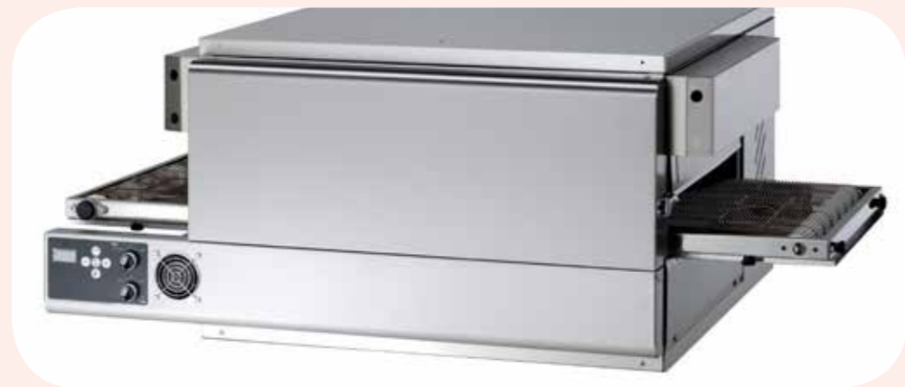
FORNI PIZZA - MODULO HI-TECH Alimentazione elettrica, Forni statici elettrici disponibili in vari modelli. Con pannello di controllo. Potenza da 6 a 8,5 Kw. Dimensioni porta cella forno LxPxH: 600x400 mm.