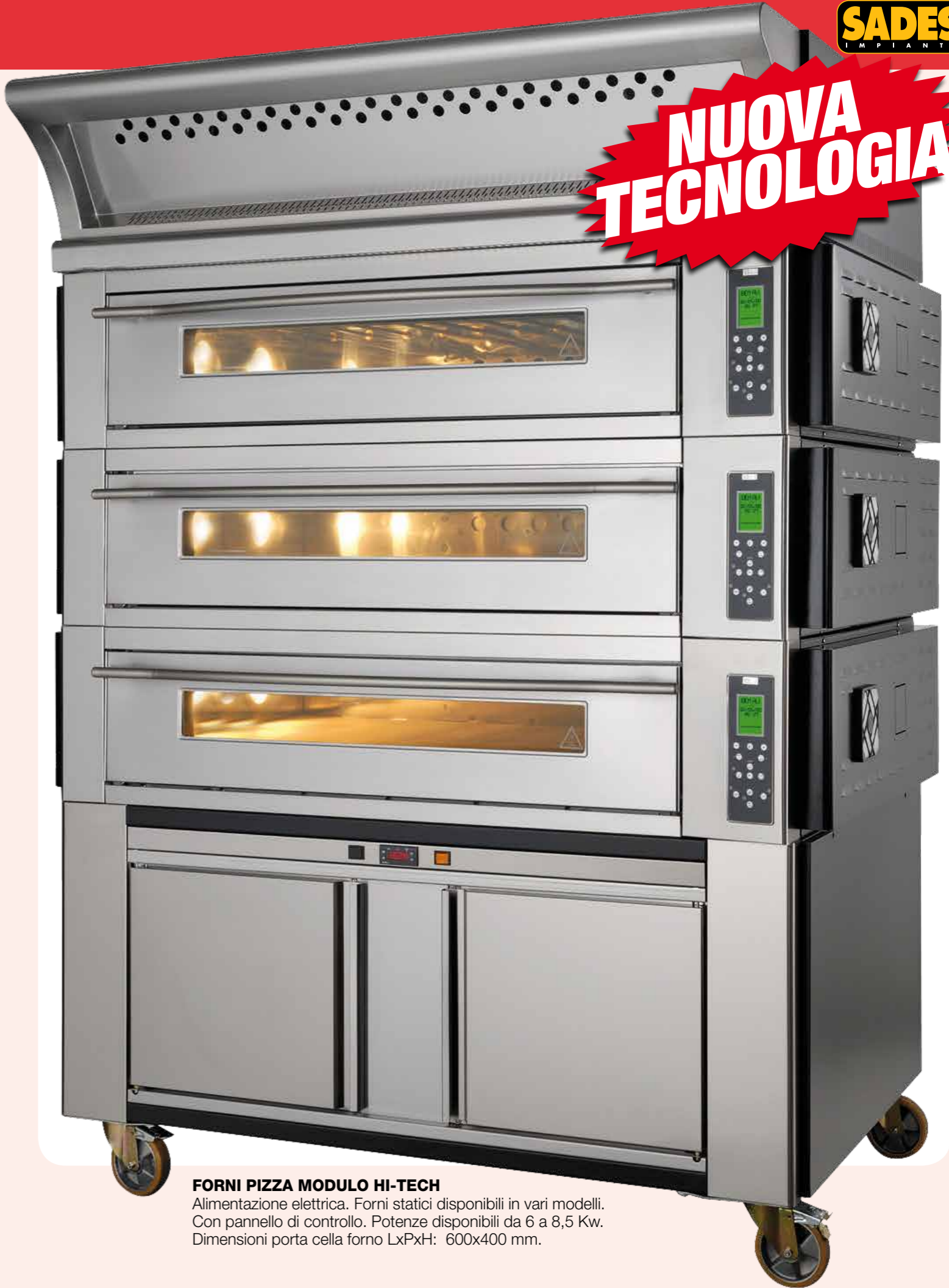
FORNI PIZZA MODULO HI-TECH Alimentazione elettrica. Forni statici disponibili in vari modelli. Con pannello di controllo. Potenze disponibili da 6 a 8,5 Kw. Dimensioni porta cella forno LxPxH: 600x400 mm.