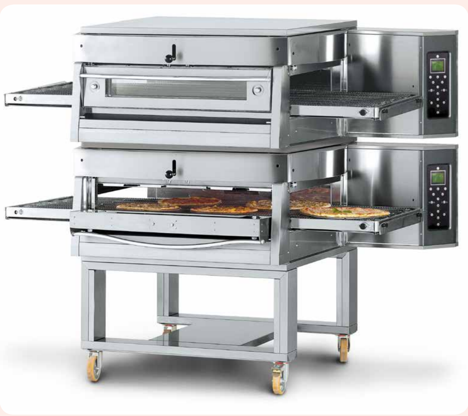
FORNI PIZZA MODULO HI-TECH Alimentazione elettrica. Forni statici disponibili in vari modelli. Con pannello di controllo Potenza da 6 a 8,5 Kw. Dimensioni porta cella forno LxPxH: 600x400 mm.