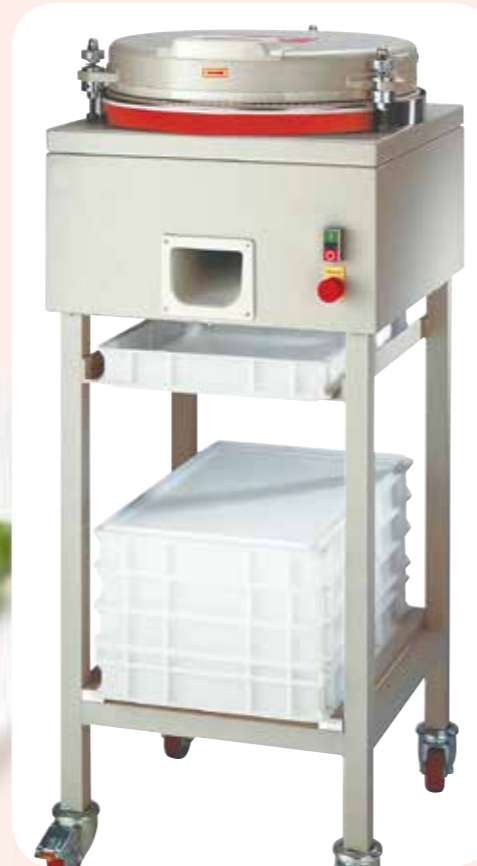
ARROTONDATRICI Alimentazione elettrica. Capacità della tramoggia di 30Kg. Dimensioni LxPxH: 570x610x500 mm.