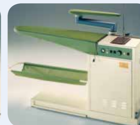
PIANO DA STIRO ASPIRANTE Piano da stiro aspirante, riscaldato con termostato. Dimensioni LxP: 1120x350 mm. per il piano da stiro.