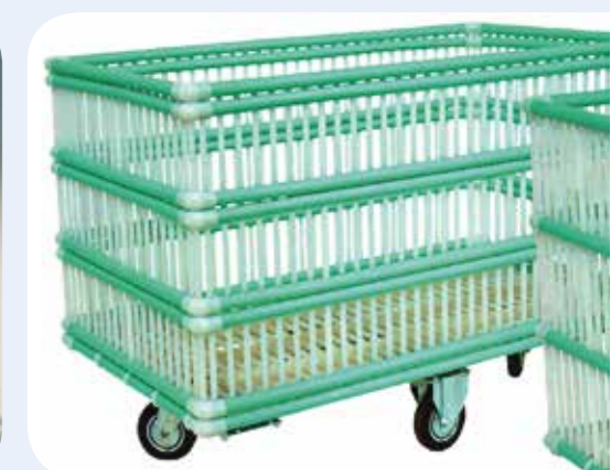
CARRELLI IN POLIPROPILENE Carrelli in polipropilene. Telaio di base in acciaio zincato. Capacità da 210 a 570 litri.