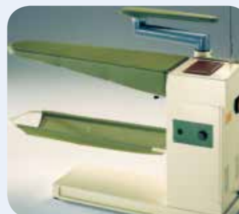
PIANO DA STIRO ASPIRANTE Piano da stiro aspirante, riscaldato con termostato. Dimensioni LxP: 1120x350 mm. per il piano da stiro.