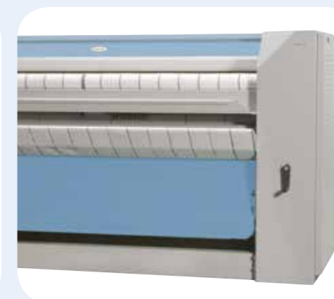
MANGANI ESSICCANTI CON PIEGATORE Piano di stiratura 1910 mm. e rullo da Ø 479 mm. Dimensioni LxPxH: 2575x1070x1270 mm.