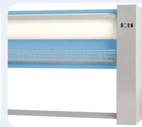
MANGANI ELETTRICI Rullo da Ø 230 mm. Dimensioni LxPxH: 1000x1400x1650 mm.