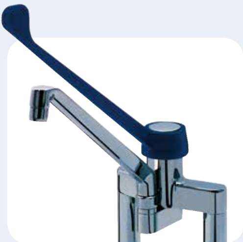
RUBINETTO DA LAVELLO CON LEVA CLINICA Rubinetto "Biforo" da banco con gambi di fissaggio lunghi 50 mm. ed interasse da 155 mm. Cartuccia miscelatrice grande portata, leva clinica lunghezza 300 mm. in plastica e canna girevole.