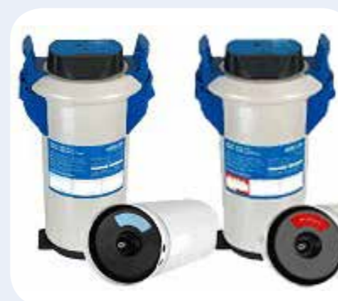
ADDOLCITORE PER LAVASTOVIGLIE Addolcitore acqua esterno automatico da 8 lt Dimensioni LxPxH: 245x480x560 mm.