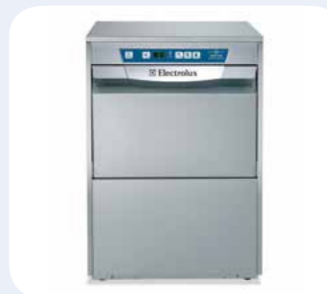
LAVASTOVIGLIE 720 Alimentazione elettrica. Lavastoviglie sottotavolo active, 720 piatti/ora, coibentata, con sistema risciacquo GRS, filtro vasca e dosatore brillantante. Dimensioni LxPxH: 600x600x850 mm.