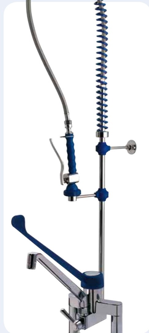
GRUPPO DOCCIA Gruppo doccia prelavaggio stoviglie su BIFORO MIX da banco. Gambo di fissaggio lungo 50 mm. e interasse da 155 mm. Cartuccia miscelatrice grande portata, leva clinica in plastica da 220 mm. e canna girevole.