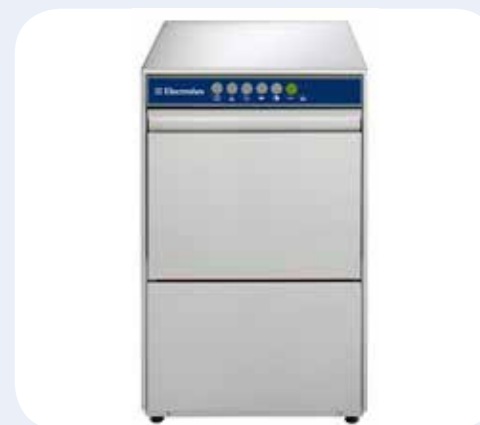
LAVABICCHIERI Lavatazzine per bar con addolcitore. Dimensioni LxPxH: 460x565x715 mm.