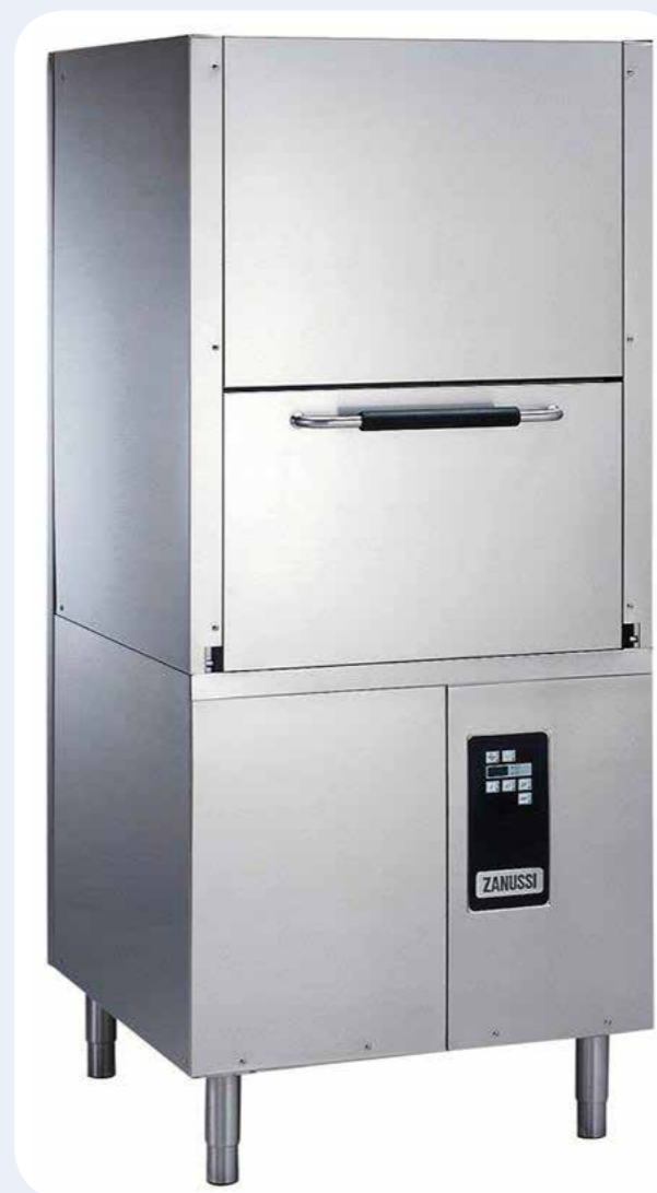
LAVAPENTOLE/OGGETTI Alimentazione elettrica. Perfette per la pulizia di pentole, casseruole, utensili, vassoi e contenitori gastronorm. Dimensioni LxPxH: 876x900x1770 mm