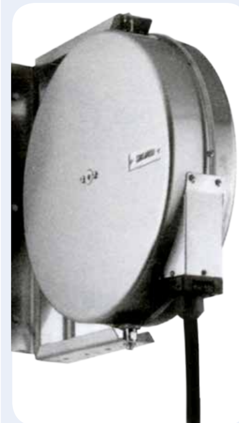
GRUPPO DOCCIA CON CANNA ESTRAIBILE "MAXI REEL" Gruppo doccia basculante a parete con tubo estraibile e riavvolgimento automatico. Tubo in gomma alimentare. Idropistola modello "Nito-2" e involucro inox AISI 304.