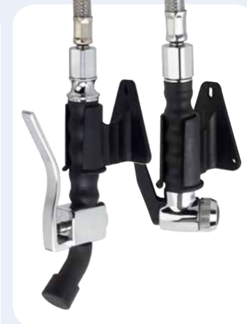
DOCCE Doccia basculante a parete con tubo per il prelavaggio.