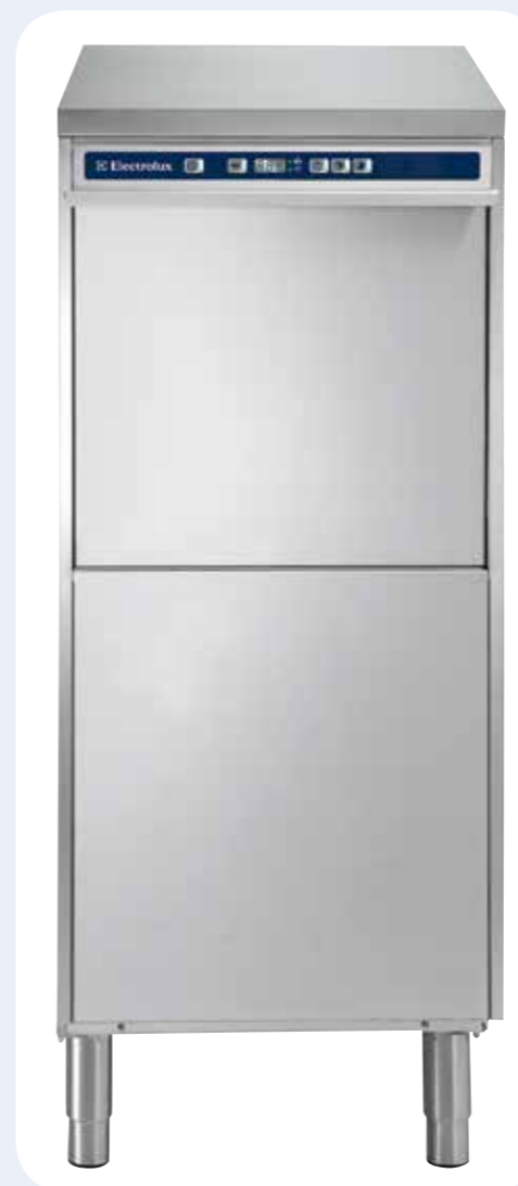
LAVASTOVIGLIE 1170 P/H Alimentazione elettrica. Lavastoviglie carica frontale. Capacità 1170 piatti/h, con pompa di scarico e boiler a pressione. Dimensioni LxPxH: 642x723x1477 mm.