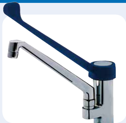
RUBINETTO DA LAVELLO CON LEVA CLINICA Rubinetto "monoforo" da banco. Cartuccia miscelatrice a dischi di ceramica e canna fusa girevole.