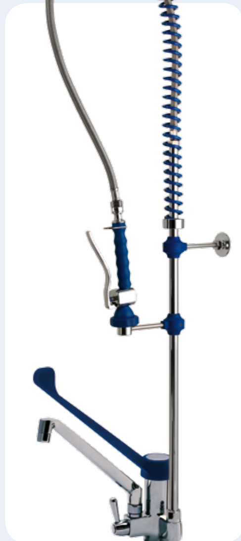
GRUPPO DOCCIA Gruppo doccia prelavaggio stoviglie su MONOFORO MIX da banco. Gambo di fissaggio lungo 80 mm. Cartuccia miscelatrice grande portata, leva clinica in plastica da 220 mm. e canna girevole da 225 mm. e Ø da 25 mm.